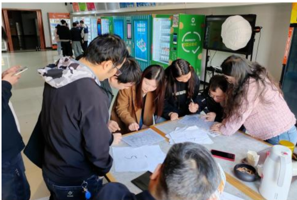
图 卓 团 建 共