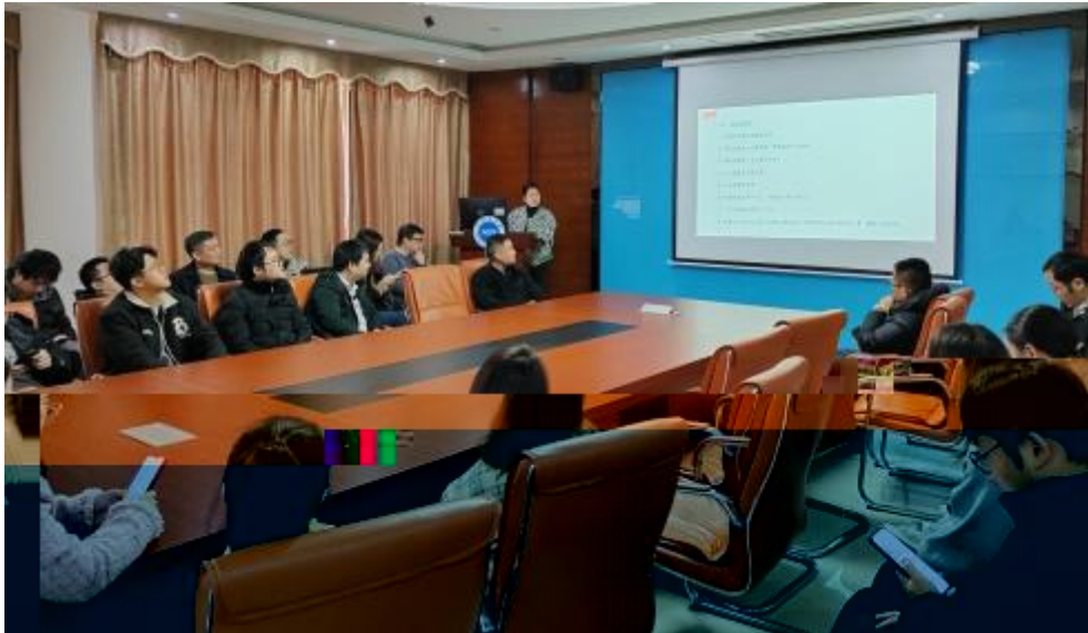
图 员工专业技 培