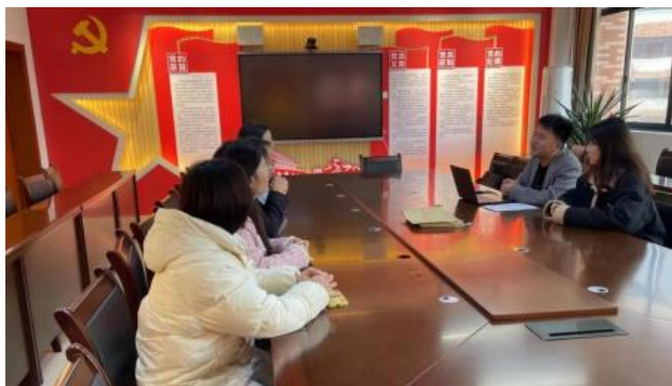
图 2-1 企开展学术 交 会